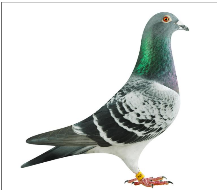
NL 19-1244604 'ARNALDO'