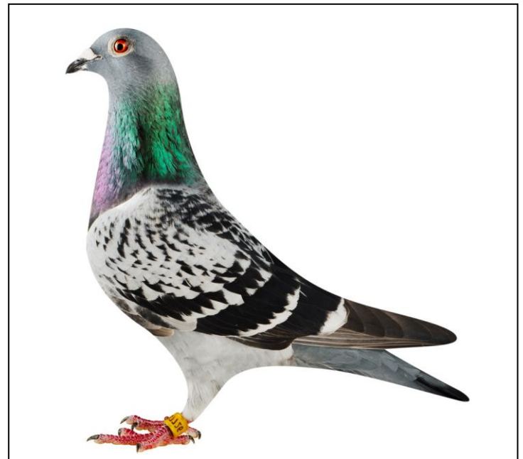
NL 19-4737726 'SIFAN'