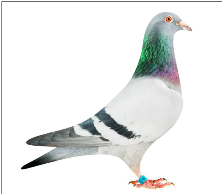
NL 16-1072680 'Augusto'