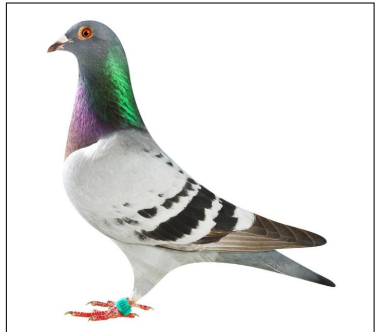
NL 18-4718177 'Thaisa'